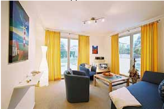
- Wohnzimmer -