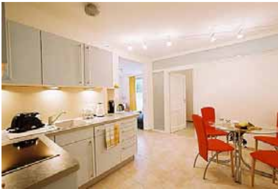
- Küche -